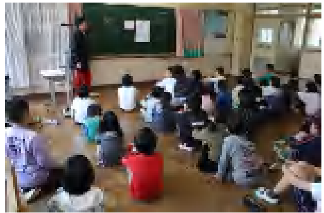
通学班別集会（西台地区）で安全，安心な登下校について話し合いました。（於：児童会室 H24.4.9）

小学校6年間の通学班で学ぶものは大きいと言えます。児童達が仲よく，安全で安心した登下校ができ，協力・思いやり・耐性などをはぐくめる通学班になることを祈っています。