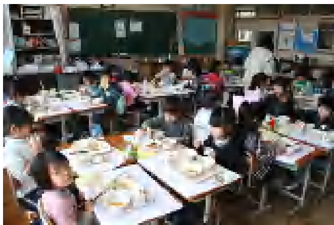
銚田小での初めての給食。和やかな落ち着いた雰囲気での給食の時間でした。(於：銚田小1の1教室 H24.4.9)

この新学期は，このようなことまで配慮しながら，学校，家庭，地域社会が密な連携を図り，児童が「安全で，安心した学校生活」が送れる環境づくりに努めねばならない時期と言えます。ご理解，ご協力の程切にお願い申し上げます。